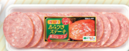
厚切りあらびき ステーキ