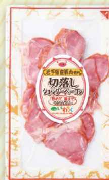
岩手県産切落し ショルダーベーコン