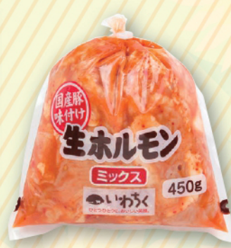
国産豚味付け 生ホルモンミックス