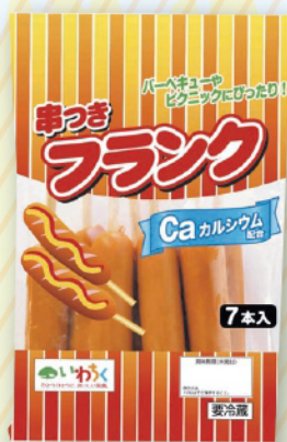
串つきフランクフルト カルシウム入り