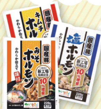
味付けホルモン やわらか仕立て (みそ・塩・キムチ)