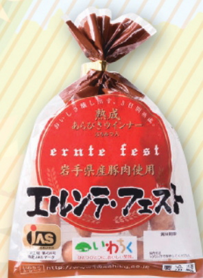
岩手県産豚肉使用 熟成あらびきウインナー (エルンテ・フェスト)